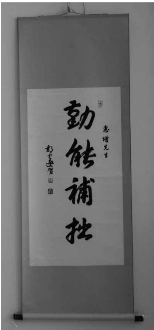
◆創作時間：1996 年 4 月 26 日

當時全班約 30 餘人，我年 18 歲。當時我因家貧，有幾次竟從江灣鎮家中步行至上海市青年宮，省下車費到「朵雲軒」購買碑帖和毛邊紙練字。在全班同學中，