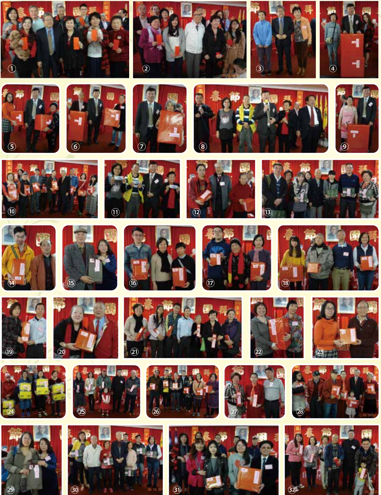
①~③②、新春團拜摸到獎品的鄉親們及提供摸彩品的鄉親們合影。