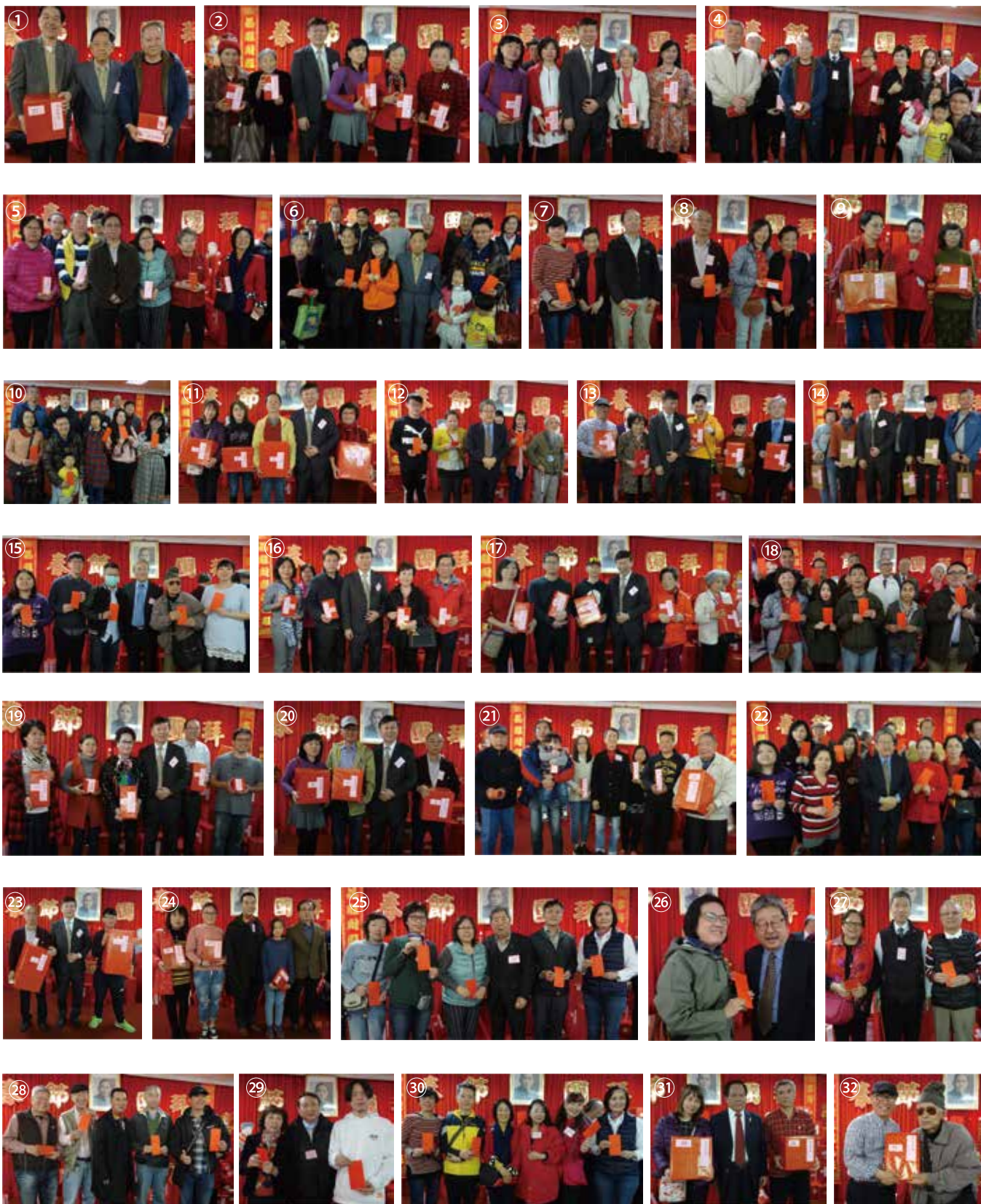
①～③②、新春團拜摸到獎品的鄉親們及提供摸彩品的鄉親們合影。