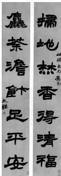
清·書畫家、篆刻家趙之謙聯句： 掃地焚香得清福，粗茶淡飯足平安。