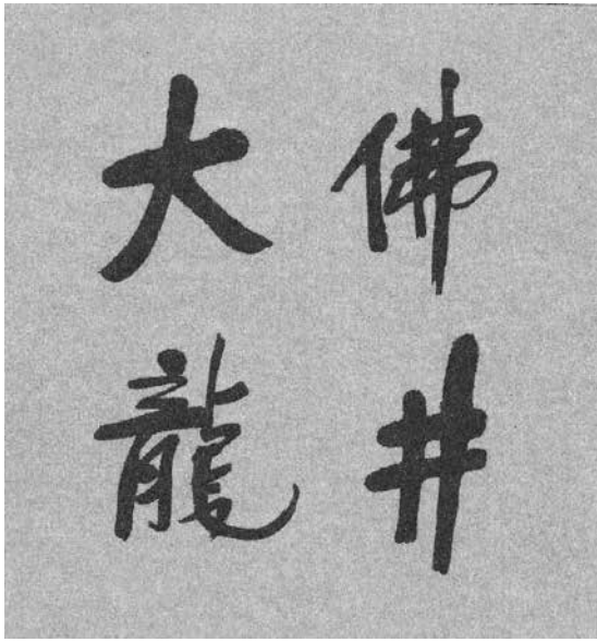
2000年6月，金庸為浙江省新昌縣公共名茶品牌大佛龍井題字。

版《金庸茶館》雜誌。金庸非常高興，他認為在茶館以書會友，交流探討心得體會，很有意義，為雜誌寫了一篇發刊辭——《關於「金庸茶館」》，結尾部分談到金庸茶館的由來，引錄如下：