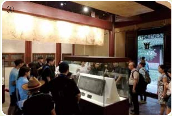
①、④、參加兩岸大學生夏令營的學生們在寧波、奉化參訪。