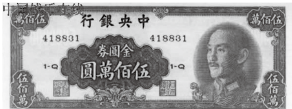
民國 37 年面值伍百萬元金圓券

野戰部隊是地上作戰單位，不適合四十多歲的士官兵，除非在廚房做伙伕兵，就算連部的雜兵在作戰時都得端槍上刺刀。我剛下部隊服役到台中后里報到，遇到第一個江連長是結了婚的軍官，他似乎唸過初中，因為粗識幾個英文字。副連長就是個北方人老粗，直爽。報到是慢車由台北愧到台中，再等車轉公路客運，一入營房立即加入晚點名集合訓話。因為士官及士兵總覺得軍官軍餉高，又整天命令他們出