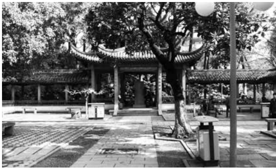
總理遺囑亭，攝於 2015 年 3 月 28 日

比對各個時期中山公園（中山廣場）的平面圖與照片，最初的總理遺囑亭位置應該是在今中山公園門樓與景行牌樓之間的中軸線上，高臺圓頂圓柱圓護欄似乎均是石質的歐式涼亭，名曰中山亭。與一九九二年原址重建亮相的民族式琉璃瓦四方型是不一樣的，與現在見到的飛簷重瓦紅木的仿古樓閣式（一九九八年重建）也是風格迥異。