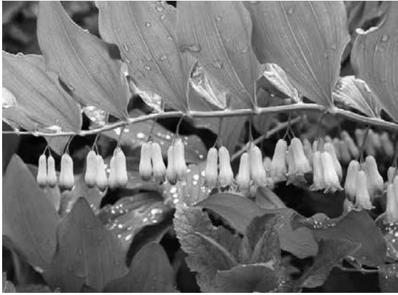
黃精綠葉蔥翠，細花優美。