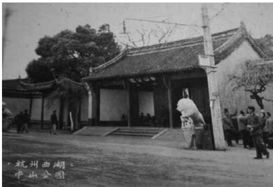
上世紀五六十年代的中山公園（自藏老照片）

一九二七年，杭州市政廳擬將西湖公園改為中山公園；一九二八年浙江省政府「以西湖本為一大公園，前設孤山公園毫無意義，茲擬改為中山公園以垂不朽，業經政府委員會決議通過並令杭州市長照辦」。當年中式門樓的上方匾額正中，就是時任浙江省政府秘書處第二科科員沙孟海題寫的中山公園四個大字。