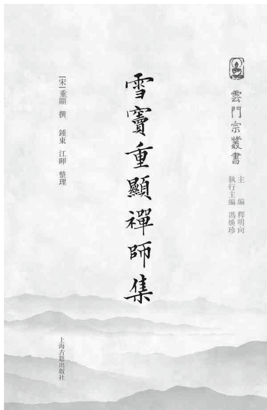
上海古籍出版社 2016 年 9 月版《雪竇重顯禪師集》書封