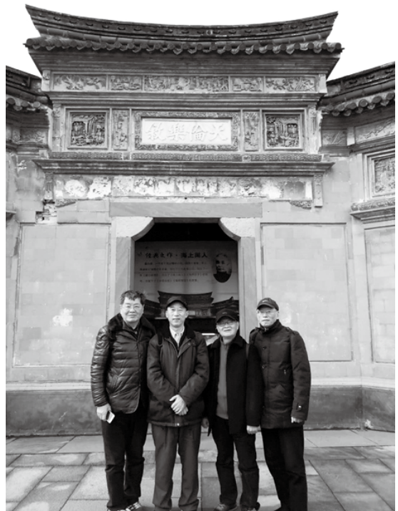
作者（左）與友人在虞洽卿舊居前