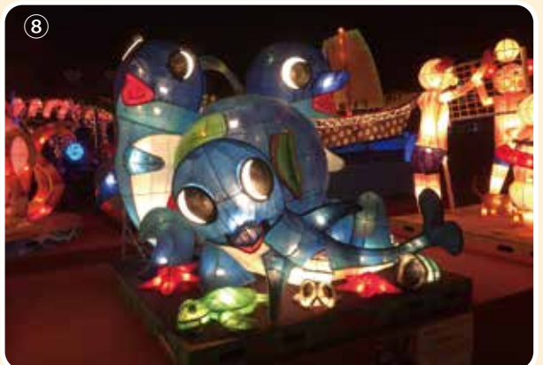
⑤~⑧、台灣燈會中不同造型的燈引人注目。