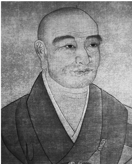
雪竇重顯彩色畫像