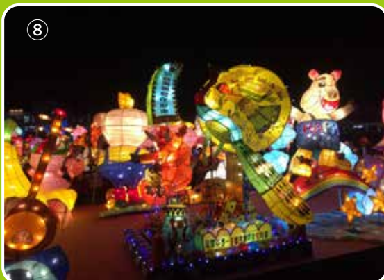
①~⑧、2019年台灣燈會在屏東舉行，各式藝術燈具在不同區展現風采。