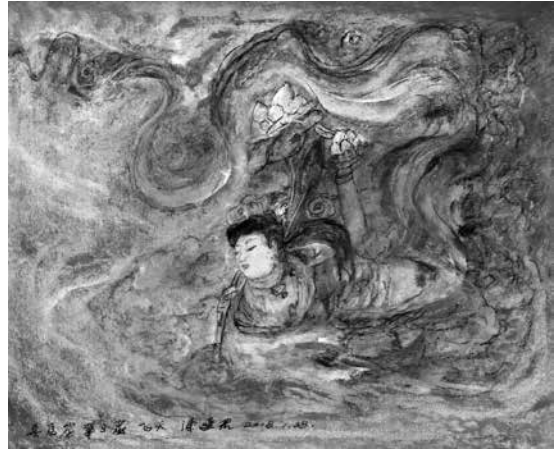
莫高窟第 3 窟飛天

藏書十萬，文史哲儒釋道，文化藝術兼修；陳燮君畫畫很執著，竟構建出一個油畫「意象系列」為人嘖嘖讚賞。與其說，陳燮君集敦煌有緣多年的厚積薄發，用色塊與心緒而「樂哉優哉」于歐亞文明的大