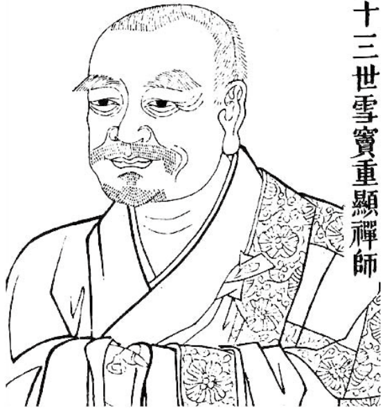
四十三世雪竇重顯禪師