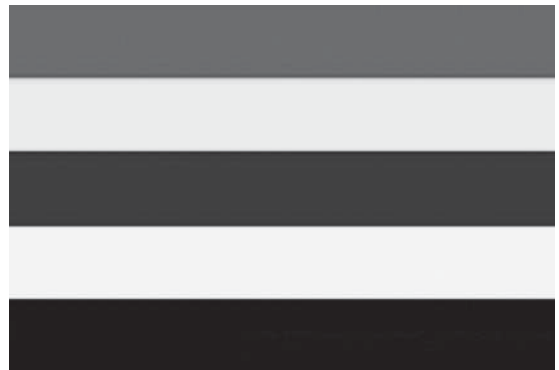
民國初期的五色共和旗

清帝遜位後，民國初期的五色旗，我國第一面國旗，紅、黃、藍、白、黑，分別代表了漢、滿、蒙、回、藏諸民族，共榮共存。先人是何等智慧，可恨的是被軍閥所撕毀！（下）