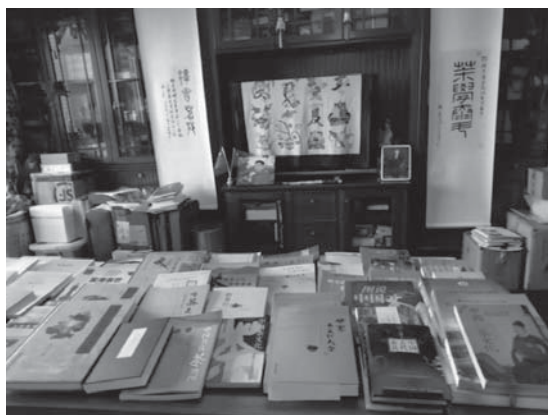
姚老部分個人專著