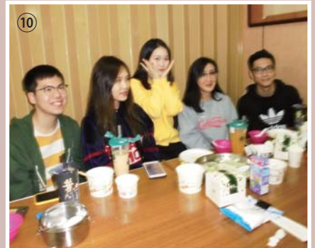
③~⑩、本會108年甬台學生冬至聯誼於12月21日下午在本會二樓中正堂舉行，兩岸學生齊聚一堂包湯圓、餃子、玩遊戲，至晚八時，盡興而歸。