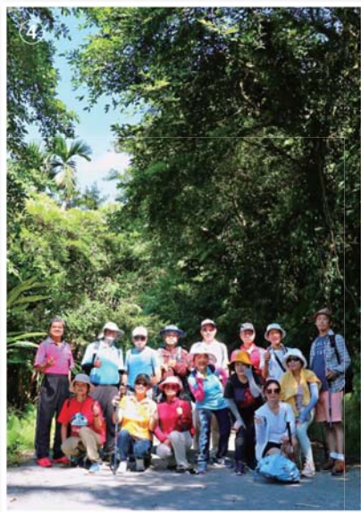
④、菁英聯誼會抹茶山健行。