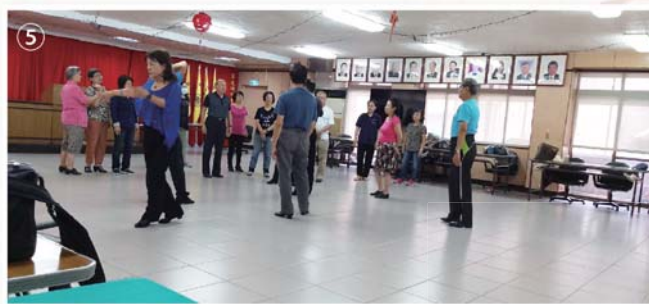
⑤、本會社交舞每週二上課，鄉親們熱情參與。