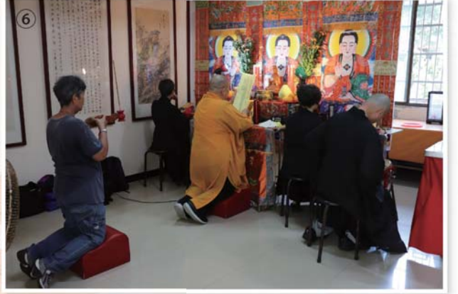
④~⑥、2020. 8. 29本會中元法會，誦經超渡亡靈並施放蘭盂餞口，普渡眾生。