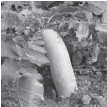
長在田裡的長蘿蔔

阿娘稱呼蘿蔔，通常以外形，如圓蘿蔔、長蘿蔔等；以皮色，如白蘿蔔、紅蘿蔔等；有時候很特殊，如細長幽幽的叫「人參蘿蔔」、再小點且有鬚鬚頭的叫「紅皮老蟲（鼠幼崽）」、板栗般的叫「小蘿蔔頭」等。阿娘鑒定蘿蔔品質很在行，挺有實踐經驗，只要托在手點心，只要在手掌上顛一下便心中有數了。凡是實墩墩的，外表光潔的，就是