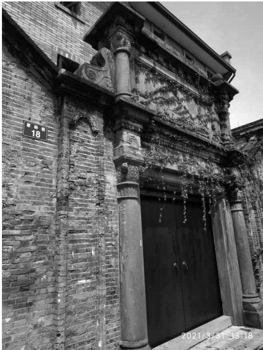
寧波市文史研究館位於海曙區金匯小鎮惠政街巷18號老房子

據文史研究館相關負責人介紹，文史研究館將努力擔負起舉旗幟、聚民心、育新人、興文化、展形象的使命任務，在豐富文化內涵、夯實文化載體、厚植文化優勢等方面發揮積極作用，成為加強團結聯誼、廣泛凝聚共識、增進思想引領的重要平臺。