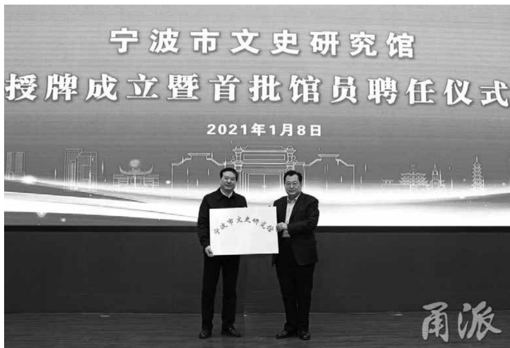
寧波市文史研究館授牌成立儀式上，市委副書記、市長裘東耀（右）向市政協副主席高慶豐授牌。（圖片引自甬派公眾號）