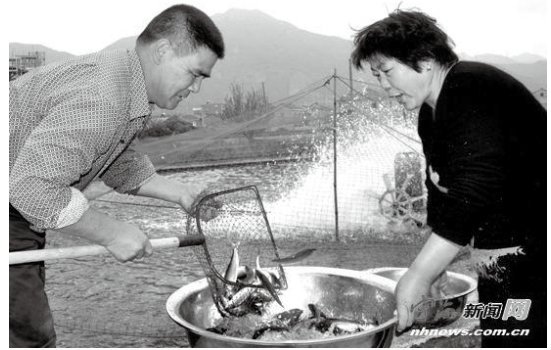
鳧溪村新苗香魚養殖基地的養殖戶正在捕撈第一批上市香魚。