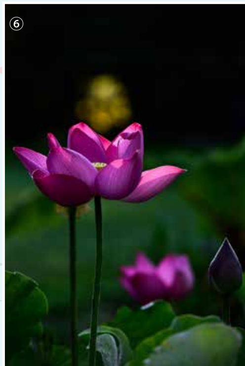
⑤~⑥、盛夏時的美麗荷花