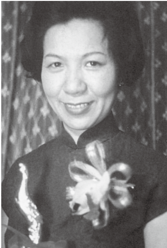
媽媽得到十大傑出女青年 金鳳獎 1968 年