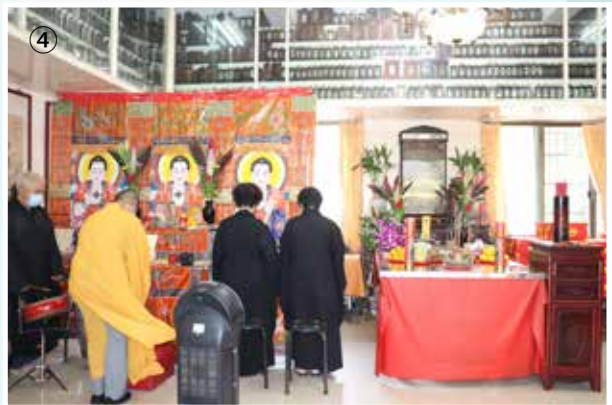
①~④、2021. 8. 21本會舉辦中元祭祖，雖在疫情期間，鄉親們仍虔誠的向祖先致敬。