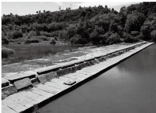
全國重點文物保護單位，世界灌溉工程遺產它山堰

水為茶之母，說茶多論水。在寧波西郊鄞江鎮，建於唐太和七年的它山堰，可與我國古代著名水利工程都江堰、鄭國渠、靈渠相媲美，今為全國重點文物保護單位，世界灌溉工程遺產。