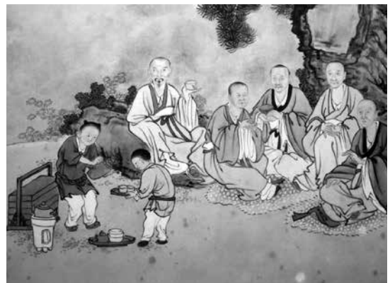
名畫《鄞江送別圖》局部。該圖描繪甬上親友在鄞江邊上，以茶餞別萬斯同赴京編修《明史》。圖中有 4 人手持茗碗，2 名童僕在侍弄茶水。