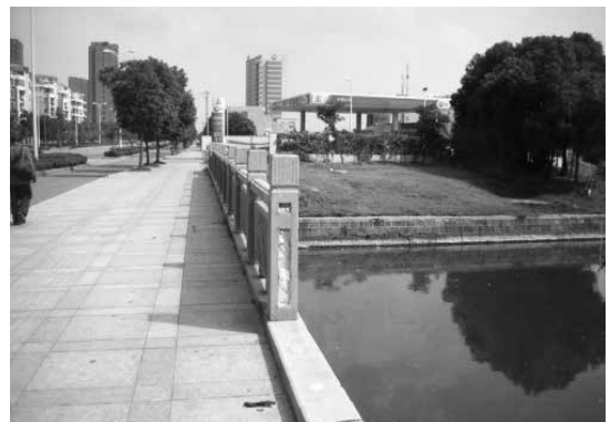
現在金華河上的南二西路新橋

比起阿拉上海屋裡廂，外婆屋落顯得十分寬敞，外婆的三個因相繼出嫁，更加顯得空空落落。（四之三）