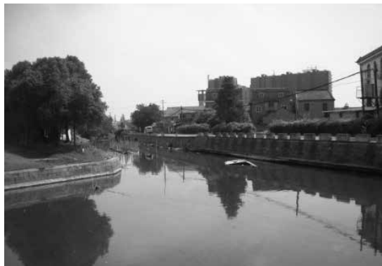
靜靜的南北流向金華河舊貌

二是推廣雙輪雙鏟犁。廟裡擺出了新農具，由兩個輪子——耕作時行走平穩，兩張犁鏟——耕作時可深可淺；容易操作，兩張犁鏟提高耕地效率。但存在著農民適應性不強，價格偏高買不起，特別是不適用寧波水田土質粘軟，犁體過於笨重，任憑兩頭壯牛如何使勁，也無法拖動自身就有四五百公斤的鐵傢伙，常常深陷田間，無法繼續耕作。於是，後來有說法：雙輪雙鏟耕牛落眼淚。