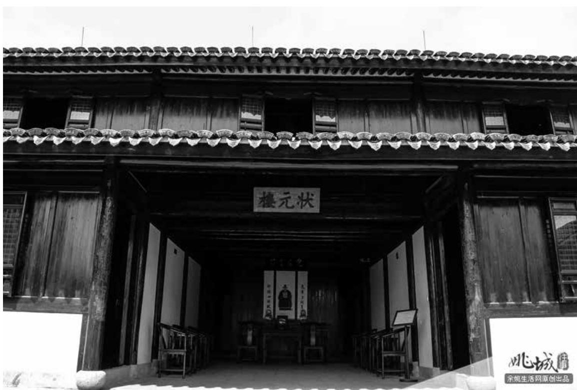
謝遷故居及出生地狀元樓，「謝閣老傳說」為餘姚市非物質文化遺產。

謝氏祠堂有一幅對聯：「古今三太傅，吳越兩東山」。三太傅，指晉朝太傅謝安、宋朝太傅謝深甫、明朝太傅謝遷；兩東山則指謝安隱居地上虞東山和謝遷生活地餘姚東山。