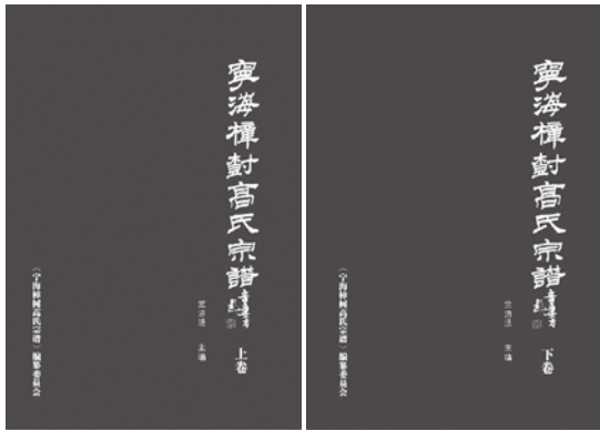
《寧海樟樹高氏宗譜》由海派大家童衍方先生題簽。

地至東南盡，城孤邑屢遷。 行山雲作路，累石海為田。 蜃炭村村白，棕林樹樹圓。 桃源名更美，何處有神仙？ 縹緲蛟龍宅，風雷隔杳冥。 人家多面水，島嶼若浮萍。 煮海鹽煙黑，淘沙鐵氣腥。 停驂方問俗，漁唱起前汀。