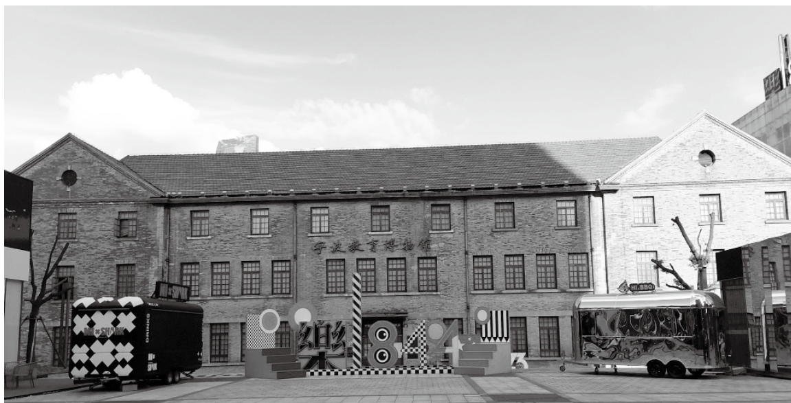
寧波教育博物館有程端禮的《讀書分年日程》展示

方孝孺字希直，亦稱正學先生，寧海大佳何鎮溪下王村人。明初大儒、翰林學士、文學家、思想家。修撰典籍，方