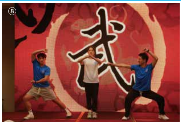
①~⑧、本會甬台大學生參訪團的師生們，在寧波、杭州展開多項參訪活動，於8月7日回到寧波大學舉行閉營儀式和聯歡晚會，本會學生提供精彩的表演活動。