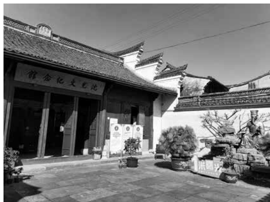
沈光文紀念館有臺灣同胞贈送的沈光文雕像，常有兩岸同胞參拜敬仰（海曙區石碶街道星光村沈家東 110 號，櫟社街底寶佑橋下）。

風土民情的第一手資料），創立了臺灣最早的詩社「東吟社」，使臺灣真正接上了中華文脈，無愧為臺灣文獻始祖。