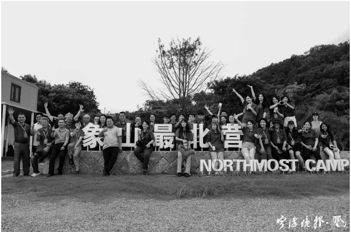
（此次甬台大學生夏令營活動大合影。）