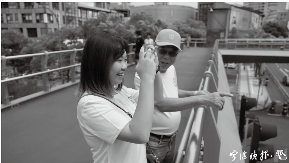
勵家爺孫利用難得的自由活動時間，逛了逛寧波街頭，定格下這座城市。