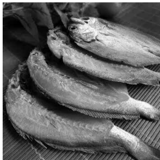
半風乾養殖黃魚鯊

該詩描寫東海、南海之海產，除了郎君鯊，製作干貝的江珧柱、水母海蜇、墨魚都是上等海鮮。