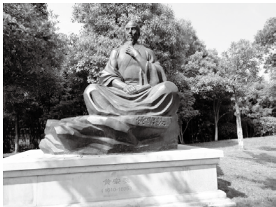
白雲莊門口的黃宗羲像，黃宗羲在此創立甬上證人書院，開創的浙東學派在中國思想史上占重要地位。

黃宗羲學問極博，思想深遠，著作宏富，一生著述 50 餘種，300 多卷。其中最為重要的有《明儒學案》（是中國第一部斷代學術史專著）、《宋元學案》、《明夷待訪錄》、《孟子師說》、