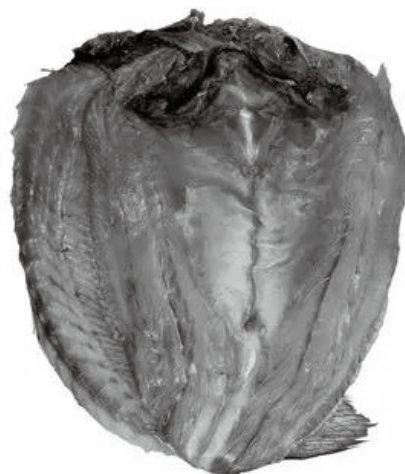
當下野生鮆魚鯊已屬珍稀