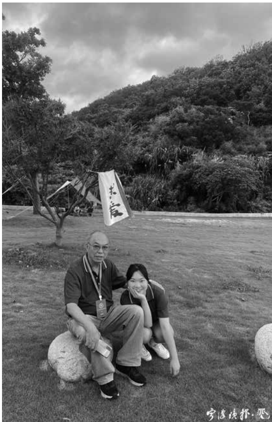
勵家爺孫在此次寧波之行的合影。