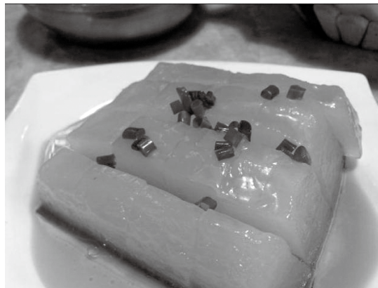
三臭中「霸主」地位——臭冬瓜

寧波漁民發現了臭冬瓜——這當然只是一種推測。臭冬瓜，以及寧波人「三臭」的產生，很可能是人類沒有冷藏食物條件的後果。不排除早期這一類微生物對人體健康的危害，但是，經過「久而久之」的演變，實現了「長期共存」。如今，其他食品一旦出現類似異味，《食品衛生法》視為變質，人們往往提出棄之。但是，臭豆腐幾乎普及全國各地，而且生意興隆，《食品衛生法》既沒有說是衛生，也沒有說不衛生，屬於「避而不論」的傳統食品。