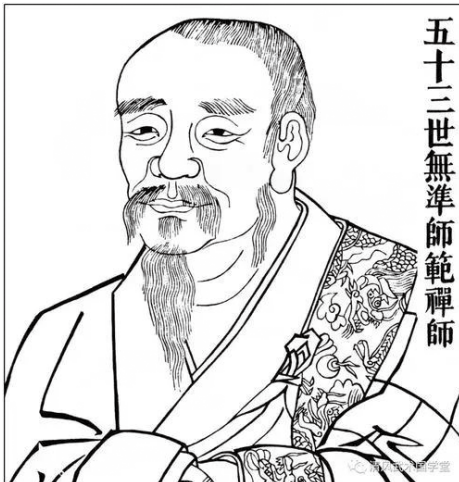
五十三世無準師範禪師