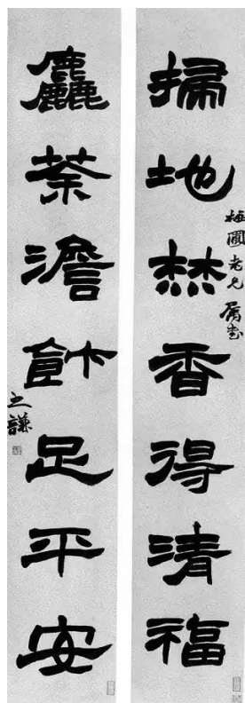
清末著名書畫家趙之謙（1829－1884）書法： 掃地焚香得清福，粗茶淡飯足平安。