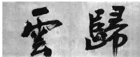
無準師範墨蹟：歸雲。