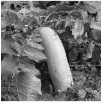
長在田裡的長蘿蔔

出現在飯桌上，謂之粗茶淡飯。蘿蔔一年四季皆有，而且價鈔絕對便宜，往往買一大堆置於屋裡廂的角落；因為青菜久置要黃葉，而蘿蔔可擺得長久，稍微乾癟食用也無妨，甚至可醃制保存，還省些鹽巴哩！