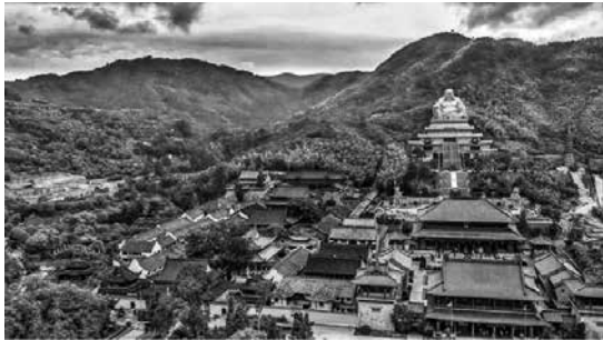
奉化雪竇寺全景

這些詩偈，讓我們看到了寺僧之日常生活，詩人以積極的人生態度，在艱苦清貧之日常生活中，樂觀修為，揭示禪理，難能可貴。